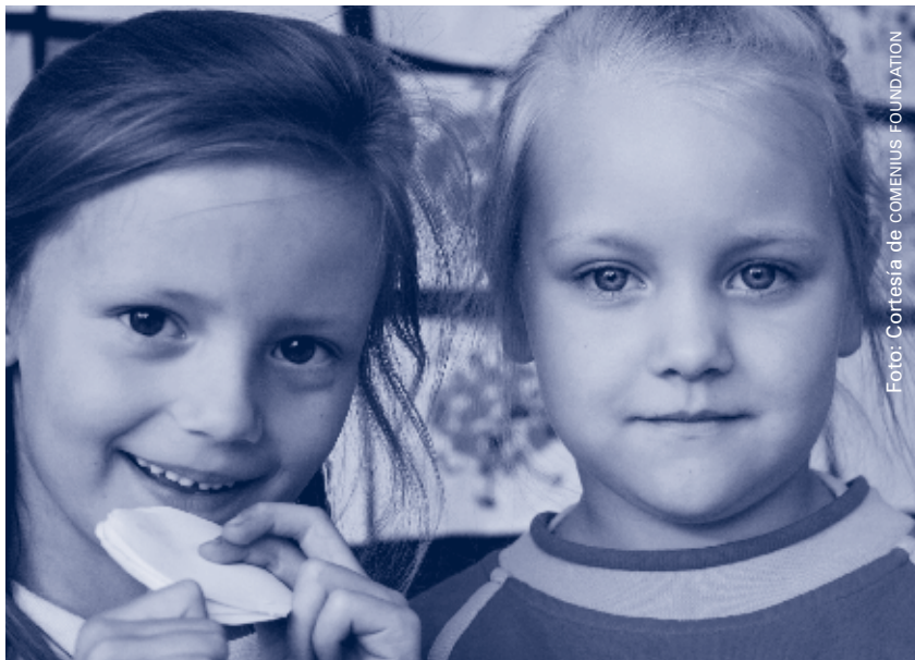
El curso de formación ayudó a los maestros a ser más conscientes del proceso de adaptación, lo que el niño siente e imagina

El resultado del curso de formación son 13 programas de formación desarrollados por los participantes, que asumen la cooperación entre los maestros y los padres de los centros de preescolar y de educación primaria. Los comentarios de los maestros son optimistas. Comenzaron a poner en práctica los progra-