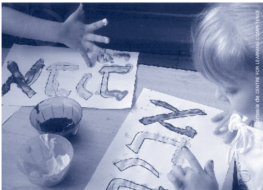
El CLC opta por crear entornos de aprendizaje que se adelantan a la emergencia de las dificultades de desarrollo y animan a todos los niños a prosperar

El enfoque cuestiona la distinción convencional entre educación para niños “normales” y la educación especial para niños con discapacidades. Reconoce que los niños adquieren habilidades en proporciones distintas y que la mayoría de ellos necesitan ayuda para desarrollar habilidades concretas. Si este apoyo se ofrece en el momento adecuado y de la forma correcta, muchos niños que, de otra forma, se hubiesen tildado de “discapacitados” pueden permanecer en entornos dominantes con niños “normales”. El CLC ofrece una terapia eficaz a estos niños diagnosticados con dificultades de desarrollo, pero prefiere crear entornos de aprendizaje temprano que se adelantan a la emergencia de las dificultades de desarrollo y animan a todos los niños a prosperar.