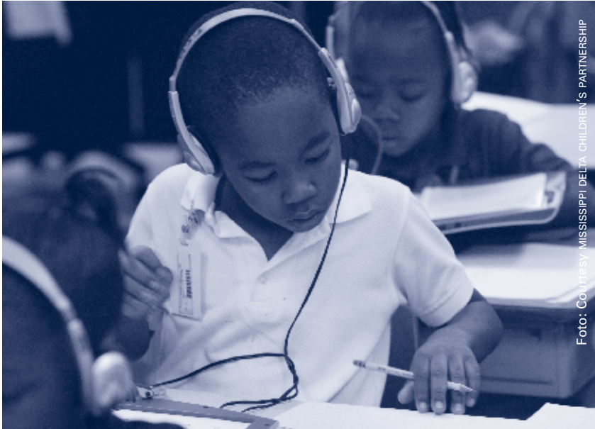
Abordamos el tema de la cultura enfatizando la integración de la historia del Delta en el plan de estudios

Cada emplazamiento dispone de un programa centrado en el niño y diseñado de forma independiente que hace hincapié en el desarrollo del lenguaje, el rendimiento académico, el desarrollo social y cognitivo y la eficacia del propio grupo étnico. Estos programas, que se llevan a cabo en las horas extraescolares o durante el verano se denominan “Aldeas infantiles”. Las familias son componentes importantes de la Asociación y se implican a través de “Círculos familiares”, cuyo objetivo es desarrollar la autoestima de los padres mediante su reafirmación y fortalecimiento, primero como individuos y después como padres.