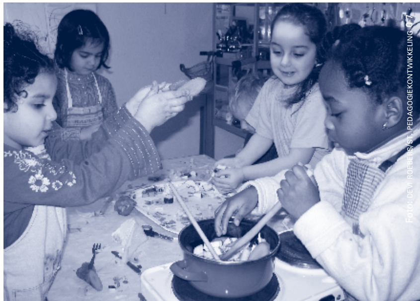
Una escuela adaptada a la niñez debe ser inclusiva, eficaz, saludable y protectora, y sensible con el enfoque de género.

Una escuela saludable y protectora dispone de un entorno de aprendizaje saludable, higiénico y seguro. Ofrece habilidades para la vida basadas en la educación en salud; fomenta la salud física y psico/socio/emocional de los maestros y alumnos; y ayuda a todos los niños a defenderse y protegerse contra los peligros, ofreciéndoles experiencias positivas.